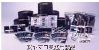
(株)ヤマコ業務用製品

<採用実績校> 九州大学、福岡大学、福岡工業大学、佐賀大学、 西九州大学、崇城大学、熊本学園大学