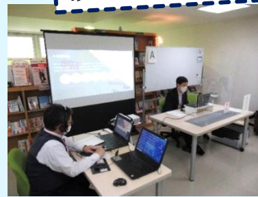
令和2年度開催の様子 対面の説明と同時にオンライン配信を実施