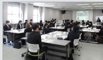
「採用内定者向けセミナー」の様子

入社直前の内定者や、入社して間もない新入社員、 入社2～3年目の若手社員などを対象にビジネス マナーやコミュニケーションのセミナーを行い、 スキルアップと職場への定着を促します。 対面やオンラインで開催します。