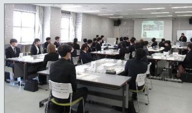
「採用内定者向けセミナー」の様子

入社直前の内定者や、入社して間もない新入社員、 入社2～3年目の若手社員などを対象にビジネス マナーやコミュニケーションのセミナーを行い、 スキルアップと職場への定着を促します。 対面やオンラインで開催します。