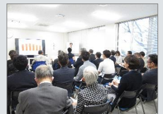
「はじめての外国人留学生採用セミナー」の様子